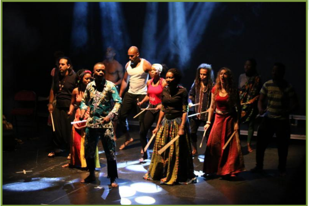
Musical “Quilombos” en Burgos